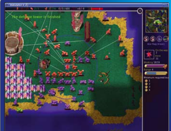
Afbeelding 2 | Oops, een lila aanval op mijn Globulation dorp. De lijntjes komen van de 't' optie, waarmee je kunt zien waar al je eenheden heen willen.